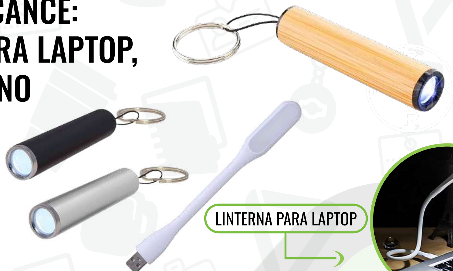
LINTERNA PARA LAPTOP

LUZ A TU ALCANCE: LINTERNA LED PARA LAPTOP, Y DE MANO